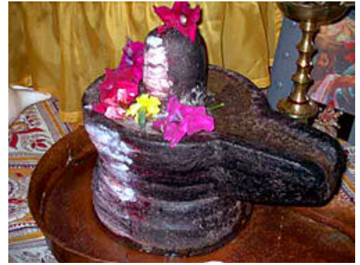
Lingam mit Yoni

Wikipedia: Das Lingam ist das Symbol der Hindu-Gottheit Shiva. Hindus sehen im Lingam nicht nur die schöpferische, sondern ebenso die erhaltende und zerstörende Kraft Shivas. Die Yoni ist der Begriff für die weiblichen Genitalien. Darüber hinaus hat das Wort viele Bedeutungen, die allesamt auch sexuelle Implikationen haben: Quelle, Ursprung, Ruheplatz, Behältnis, Aufenthaltsort, Schlupfloch, Nest.